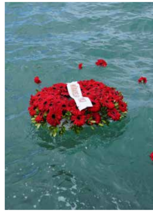
yatlarla doludur. Mübadele, sadece yer değiştirmek değildir. Mübadele, kapıyı kilitlemeden çıkmaktır. Mübadele, “nasılsa dönerim” diyerek anahtarını cebine koymaktır” dedi.

“Bu meydanda bugün bir tarih anlatmıyoruz, bu meydanda bugün bir sessizlik dinliyoruz. Mübadele, bu kelime, kitaplarda iki satırdır. Ama Ayvalık'ta bir ömürdür. Bugün burada rakamları anmak için toplanmadık. Bugün burada kaç kişinin gittiğini, kaç kişinin geldiğini saymayacağız. Çünkü bu topraklar sayılarla değil, yarım kalmış ha-